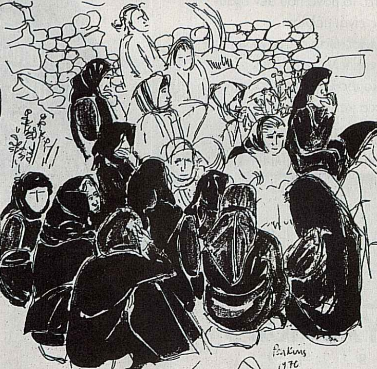
Μανιάτισσες μοιρολογούν. Έργο της Άλτα Αν Πάρκινς από το βιβλίο της «Εικόνες της Μάνης», εκδ. Ελευθερουδάκη, 1971.

– Ναι, όμως είναι και η Εκκλησία. Η Μανιάτισσα δεχόταν τον παπά στη νεκρική ακολουθία, αλλά ο ρόλος του ήταν περιορισμένος και ξεχωριστός.